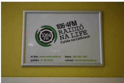
Frámaí ‘Snap’ atá ag crochadh thart timpeall an stáisiúin